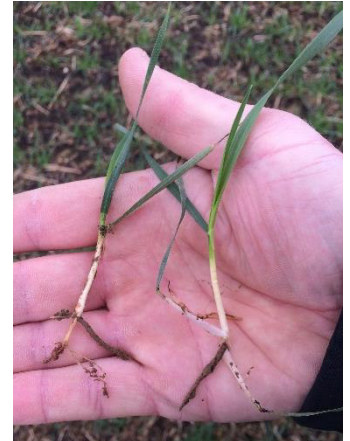
Spät gesäter Winterweizen, erst 1-2 Triebe Anfang April gebildet → Triebförderung notwendig

Die Schossergabe schwächerer Bestände, die noch Triebe anlegen müssen, sollte deshalb unmittelbar und vor allem mit schnell wirkenden Düngern (z. B. KAS, AHL, Sulfan 24/6) erfolgen.