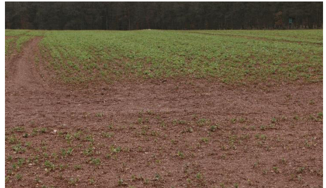
Raps (Vordergrund) durch Staunässe behindert – im Hintergrund wächst der Raps schon.....

Wenn der Boden abgetrocknet und die Wurzel wieder mit Sauerstoff versorgt wird, erledigt sich das Problem von alleine - Stickstoff hilft hierbei nicht.