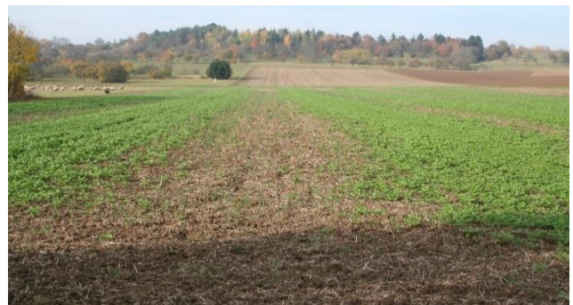
Ungleichmäßiger Senfbestand aufgrund schlechter Strohverteilung

Je besser die Aussaat, umso positiver kann sich der Bestand entwickeln. Außerdem frieren kräftig entwickelte Pflanzen über Winter sicherer ab, als schwach entwickelte Bestände.