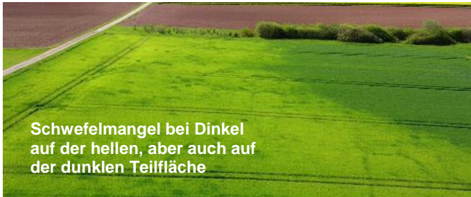
Schwefelmangel bei Dinkel auf der hellen, aber auch auf der dunklen Teilfläche

Ein Schwefelmangel äußert sich in Form von Blattaufhellungen und wird häufig auch mit Stick-