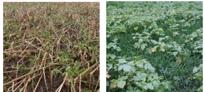
Weitgehend abgefrorene Zwischenfrucht (links) und vitale Zwischenfrucht mit Ausfallgetreide (rechts)

Ein Totalherbizid ist in beiden Fällen nicht grundsätzlich notwendig. Vor der Maisaussaat reicht die Zeit auch für eine mechanische Einarbeitung der Pflanzenreste und Vorbereitung des Saatbetts aus. Im Gegensatz zum Herbst, wo zusätzliche Bodenbearbeitungsgänge unerwünschte Mineralisierung auslösen, wird der im Frühjahr durch die Bearbeitung freigesetzte Stickstoff vom nachfolgenden Mais verwertet und belastet das Grundwasser nicht.