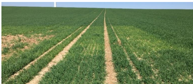
Abb. 4: Weizenbestand während Apriltrockenheit 2020 mit Fenster ohne CULTAN-Düngung durch ausgesetztes Igel-Rad.

Das Klima wandelt sich – Trockenphasen nehmen zu. In den letzten drei Jahren haben wir in besonderem Maße zu spüren bekommen, dass ein gezielter Einsatz von Düngestickstoff (mineralisch/organisch) immer wichtiger wird. Das CULTAN-Verfahren ist eine Möglichkeit im Frühjahr Trockenphasen etwas entgegen zu setzen.