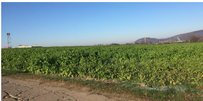
Abb. 1: Gut entwickelte Zwischenfrüchte trotz Sommertrockenheit (Ende Nov 2020)

Trotz der Sommertrockenheit sind die Zwischenfrüchte im Maßnahmenraum gut entwickelt. Die üppigen Zwischenfrüchte sind das Ergebnis früher Saattermine sowie an die Trockenheit angepasste Aussaatverfahren.