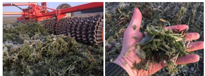
Abb. 3: Walzen von Zwischenfrüchten: Walzen bei Frost ist kostengünstiges Mulchen mit hoher Schlagkraft

Zwischenfrüchte durchwurzeln den Boden intensiv. Sie hinterlassen eine gute Bodenstruktur und eine hohe Anzahl an Grobporen, die tief in den Unterboden reichen. Die nachfolgende Kultur nutzt diese, um schnell in den Unterboden zu wurzeln. Der Pflug schafft hier keine Verbesserungen!