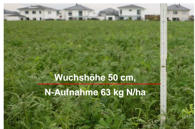
Abb. 2: Phacelia, Ramtill und AlexKlee (PGM5). Wie dieser Bestand zeigt, ist die Faustzahl sehr konservativ. Viele Bestände nehmen deutlich mehr Stickstoff auf.