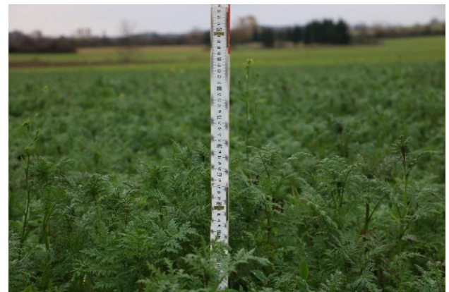
Gut entwickelte Zwischenfrüchte, wie die hier zu sehende 60 cm hohe Phacelia, sind ein Garant für niedrige Rest-N min Werte.