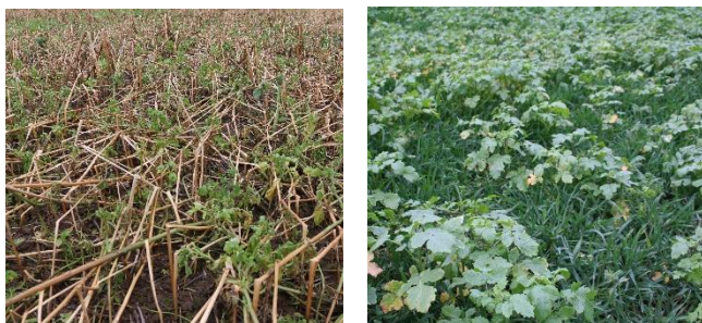
Weitgehend abgefrorene Zwischenfrucht (links) und vitale Zwischenfrucht mit Ausfallgetreide (rechts)

Kurz vor der Maisbestellung finden wir dieses Jahr auf Flächen, auf denen die Zwischenfrüchte noch nicht eingearbeitet sind, meist folgende zwei Bilder: