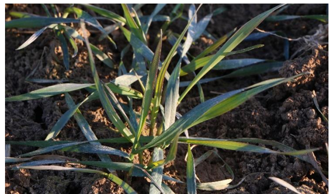
Anthocyan-Verfärbung des Weizens durch Kältestress

Tauen die Böden nächste Woche tagsüber auf, nachts herrscht aber weiterhin Frost, dürfen nicht mehr als 60 kg N/ha ausgebracht werden. Egal, ob mineralisch oder organisch gedüngt wird.