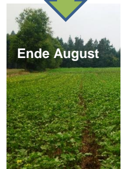
Vorerntesaat: Gelbsenf mit Schleuderstreuer