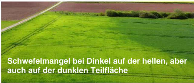
Schwefelmangel bei Dinkel auf der hellen, aber auch auf der dunklen Teilfläche

Ein Schwefelmangel äußert sich in Form von Blattaufhellungen und wird häufig auch mit Stickstoffmangel verwechselt. Eine Schwefel-Mangelversorgung kann allerdings auch schon ohne merkbare Aufhellungen vorliegen (siehe Foto rechte Schlagseite) und verschlechtert immer die N-Effizienz und damit zum Beispiel Rohprotein (Weizen), Öl-Gehalt (Raps) und Ertrag.