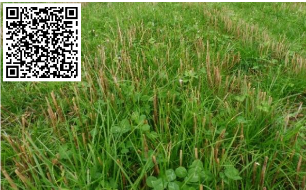
Abb. 3: Klee-grasuntersaat in Winterroggenstopfel ca. 3 Wochen nach der Ernte 2021. Für weitere Informationen bitte den QR-Code scannen

Im Jahr 2021 war es aufgrund der späten Getreideernte häufig zeitlich zu knapp, Sommerzwischenfrüchte zu etablieren. Eine arbeitsexensive Möglichkeit die Flächen zwischen Getreiden oder über Winter zu begrünen, stellt eine Klee-gras- oder Gras-Untersaat dar.