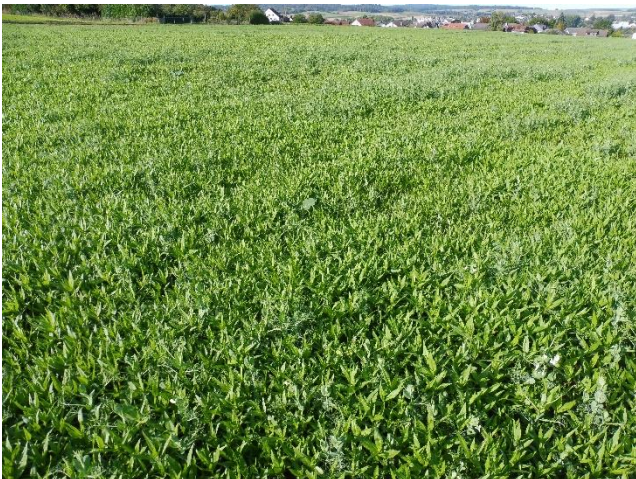
Ramtil und Ausfallerbse