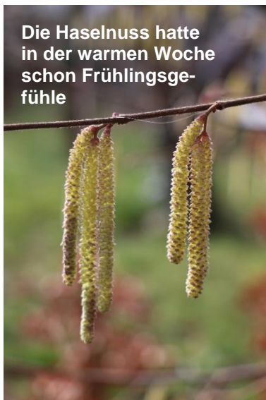
Die Haselnuss hatte in der warmen Woche schon Frühlingsgefühle

Die hohen Temperaturen der vergangenen Woche lösten schon ein leichtes Ergrünen der Winterfruchtbestände aus, was keinesfalls mit dem Vegetationsbeginn verwechselt werden sollte. Noch ist Winter und auch im Februar kann es noch kalt werden.