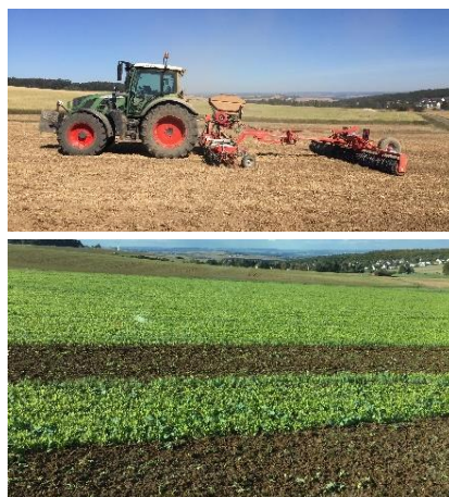
Ramtill-Aussaat mit Grünlandstriegel in Erbsenstoppel (oben), Einarbeitung Mitte Oktober mit Grubber (unten) vor der Weizenbestellung