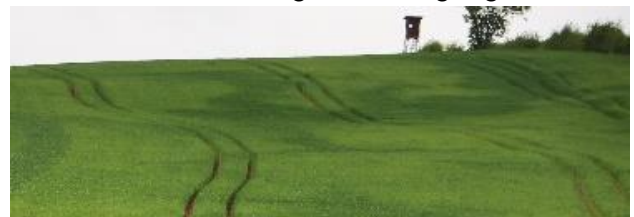
Schwefelmangel im Weizen in Nordhessen 2021

in 20 cm Tiefe im Mittel ca. 4 °C kälter verglichen zum Jahr 2020 (DWD-Station Schauenburg-El- gershausen), d.h. besonders in den Monaten, in denen das Wintergetreide normalerweise noch von der Bodennachlieferung profitieren kann. Laut der sogenannten RGT-Regel ( R eaktionsge- schwindigkeit- T emperatur- R egel) laufen bei einer Zunahme der Temperatur um 10 °C chemische Reaktionen zwei- bis dreimal so schnell ab. Dies gilt auch für Bakterien und Pilze, die maßgeblich die Stickstoff- und Schwefelnachlieferung im Bo- den steuern und den Pflanzen zur Verfügung stel- len. Wie in der Abbildung unten dargestellt, ist da- von auszugehen, dass den Kulturen in der ersten Jahreshälfte weniger Stickstoff und Schwefel aus der Bodennachlieferung zur Verfügung standen.