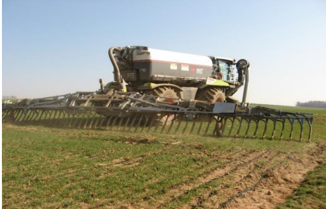
Schleppschuhverteiler für Gülle: für Kopfdüngung jetzt eine der Möglichkeiten