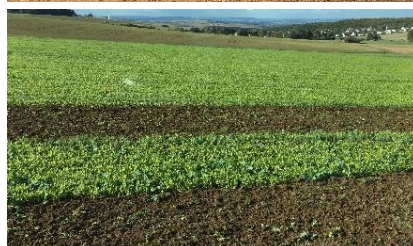
Ramtill-Aussaat mit Grünlandstriegel in Erbsenstoppel (oben), Einarbeitung Mitte Oktober mit Grubber (unten) vor der Weizenbestellung