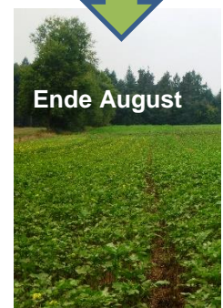
Vorerntesaat: Gelbsenf mit Schleuderstreuer