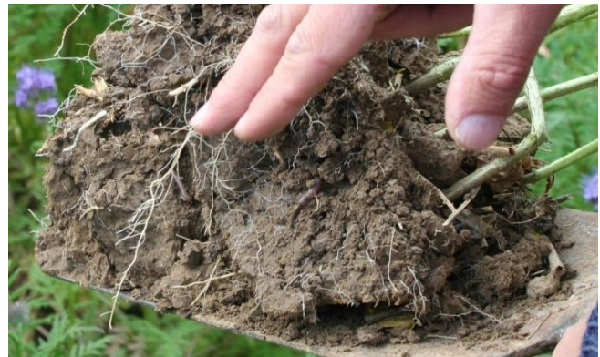
Gute Bodenstruktur einfach mit dem Spaten erkennbar

Die extreme Sommertrockenheit hat auch eine gute Seite – für die Bodenstruktur. Die Ernte von Getreide und auch Mais erfolgte unter trockenen Bedingungen. Der Boden wurde im Vergleich zu feuchteren Jahren bei der Ernte nicht belastet. Selbst „Altverdichtungen“ (u. a. aus dem nassen Herbst 2017) hat die tiefreichende Trockenheit auf den meisten Böden „geloockert“.