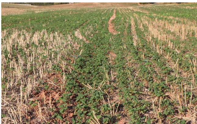
Buchweizen als Sommerzwischenfrucht kommt gut mit trockenen Keimbedingungen zurecht

Die gleichen trockenheitsbedingten Probleme wie der Raps haben auch die (zu) spät gesäten Zwischenfrüchte. Bereits geringe Bodenunterschiede machen sich dieses Jahr besonders bemerkbar. Auf vielen Flächen sind die Zwischenfrüchte erst nach dem letzten Regen (Ende September) aufgelaufen und werden keine üppigen Bestände mehr bilden. Gute Bestände bilden derzeit fast nur früh gesäte Zwischenfrüchte (Aussaat: 1. Augusthälfte). Diese konnten bereits kleinere Niederschläge im August für die Entwicklung nutzen. Später gesäte Zwischenfrüchte lagen fast überall bis vor kurzem im trockenen Boden.