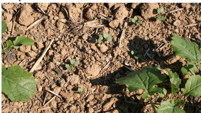
Unterschiedliche Entwicklungsstadien in diesem Herbst

Hier sollte nicht vorschnell gehandelt werden. Raps besitzt ein sehr hohes Kompensationsvermögen. Er benötigt eine Bestandsdichte von 15 Pflanzen/m 2 , um sein Ertragspotenzial auszuschöpfen . 15 Pflanzen/m 2 finden sich aktuell auf