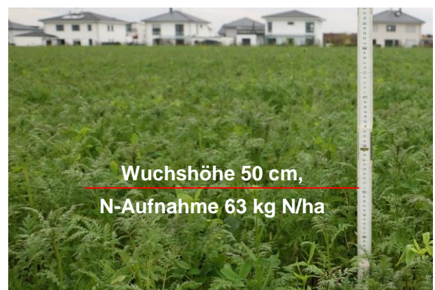
Abb. 2: Phacelia, Ramtill und AlexKlee (PGM5). Wie dieser Bestand zeigt, ist die Faustzahl sehr konservativ. Viele Bestände nehmen deutlich mehr Stickstoff auf.

Faustzahl: pro 10 cm Wuchshöhe = 10 kg N/ha