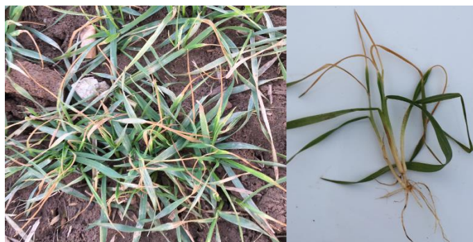
Abbildung 2: „verfrorene“ Blattspitzen (Frostschäden) bei Winterweizen, Aufnahme 22.02.2021

rene“ Blätter (Abbildung 2). Die verfrorene Blattmasse muss nun neu gebildet werden.