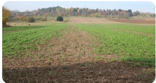
Ungleichmäßiger Senfbestand aufgrund schlechter Strohverteilung und unzureichender Einarbeitung