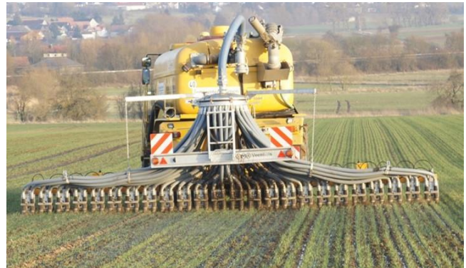
Abbildung 3: Durch Einschlitzen von Gülle in Winterweizen werden Ammoniakemissionen vermindert und die Nährstoffe direkt im Wurzelraum der Pflanzen abgelegt.