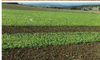
Ramtill-Aussaat mit Grünlandstriegel in Erbsenstoppel (oben), Einarbeitung Mitte Oktober mit Grubber (unten) vor der Weizenbestellung

einmal und ganz flach arbeiten, den Altraps bis kurz vor die Aussaat der Folgekultur aufwachsen lassen und dann beseitigen. Wenn der Raps nur alle sechs Jahre in der Fruchtfolge steht, wie es aus phytosanitären Gründen nötig ist, bereitet der Ausfallraps keine Probleme.