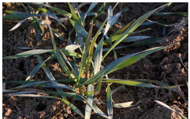
Anthocyan-Verfärbung des Weizens durch Kältestress

Tauen die Böden im Verlauf des Tages auf, nachts herrscht aber weiterhin Frost, dürfen außer bei Kompost und Festmist (Huf- und Klautiere) nicht mehr als 60 kg N/ha ausgebracht werden. Egal ob mineralisch oder organisch gedüngt wird. Zusätzlich muss ein Pflanzenbestand vorhanden sein, eine Abschwemmungsgefahr des Düngers ausgeschlossen und die Gefahr von Bodenstrukturen bei Ausbringung ohne Frost gegeben sein.