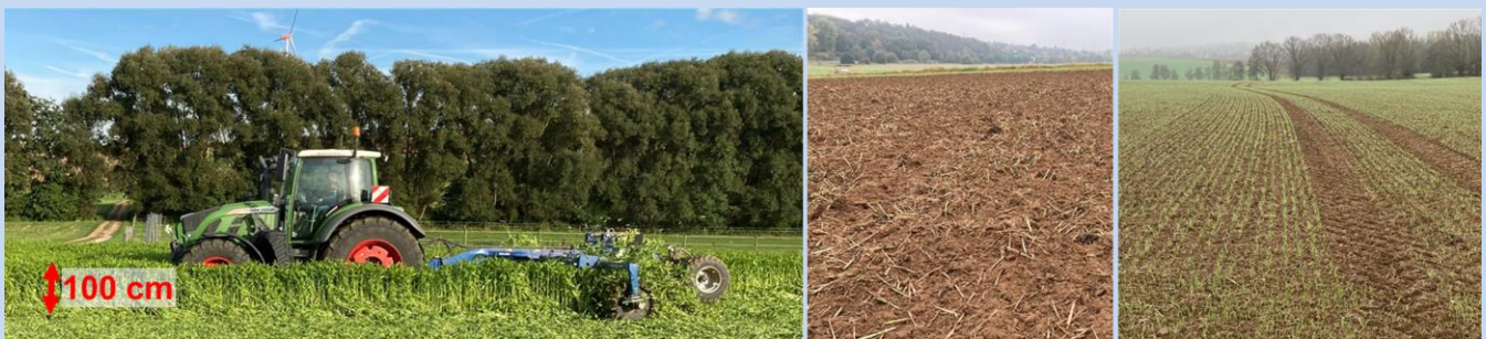
Aussaat von 15 kg/ha Ramtill mit Wiesenstriegel (Ende Juli 2021). Links: Bestand ca. 100 cm hoch, Zerkleinerung mit Messerwalze (01.10.21). Mitte: Saatbeet nach einmaligen Grubberstrich (12-15 cm tief) unmittelbar vor Weizen-aussaat (18.10.21). Rechts: homogener Feldaufgang (12.11.21)

Düngung/N-Nachlieferung zu Weizen: N min -Untersuchung für bedarfsgerechte Düngung durchführen. Start- und Schossergabe normal düngen. Die N-Nachlieferung aus der Sommerbegrünung setzt im Frühjahr mit steigenden Bodentemperaturen ein und wirkt vor allem zur Abschlussgabe.