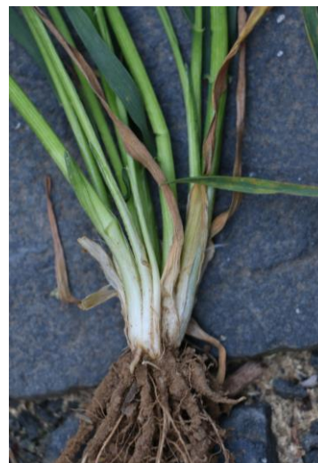
Abb.1: Stark bestockter Winterweizen mit vielen unproduktiven Nebentrieben

Aufgrund der allgemein hohen, aber auch stark schwankenden N_{\min} -Gehalte (Spannweite von 8 bis 302 kg N/ha) in diesem Frühjahr sollte der N-Bedarf zum Schossen im Wintergetreide unbedingt mit Chlorophyllmessungen ermittelt werden.