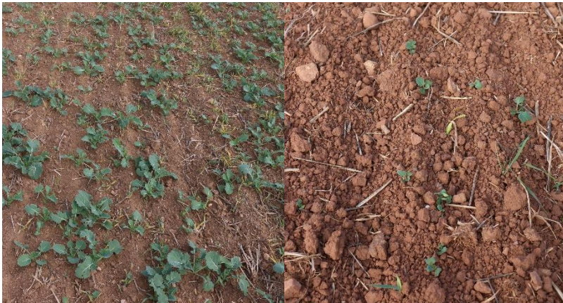
Ungleich aufgelaufener Raps auf einer Fläche mit unterschiedlichen Böden und entsprechend verschiedenem Saatbett

Auch in diesem Jahr zeigte sich, dass es wichtig ist Zwischenfrüchte bis spätestens Ende August zur optimalen Saatzeit auszusäen und nicht erst auf Regen zu warten, bevor gesät wird.