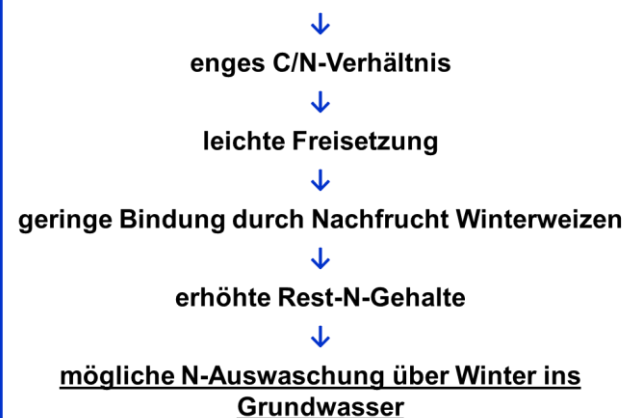
Abb. 2: Schema der Stickstoff-Freisetzung nach der Ernte von Körnerleguminosen und die Auswirkungen

Doch nicht nur nach der Ernte muss beim Körnerleguminosenanbau auf besonderen Grundwasserschutz geachtet werden: Bereits im Sommer