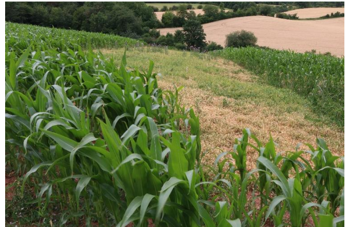
Verbliebene Mulchschicht im Juni