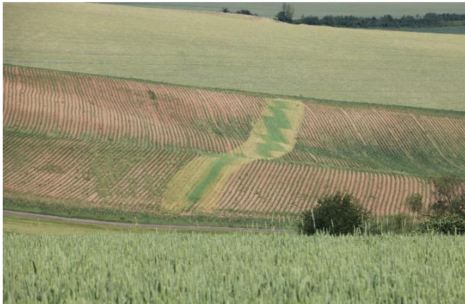
Teilweise abgespritzte Wintergerste im Erosionsschutzstreifen im Mais

Besonders bei Zuckerrüben und Kartoffeln mit früheren Applikationszeitpunkten , zu denen noch kein ausreichender Aufwuchs der Wintergerste besteht, sollte der Streifen beim Spritzen ausgespart werden .