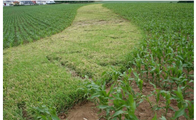
Erosionsschutzstreifen im Mais mit Wintergerste

Die wirksamste und gleichzeitig günstigste Variante ist die Anlage eines Streifens mit Wintergerste in doppelter Aussaatstärke (280-300 kg/ha). Dafür wird die Wintergerste im März bis Anfang April gesät . Die Aussaat des Erosionsschutzstreifens findet immer vor der Aussaat der Erntekultur statt. Mais, Zuckerrüben oder Kartoffeln werden anschließend durch den Streifen durch gesät.