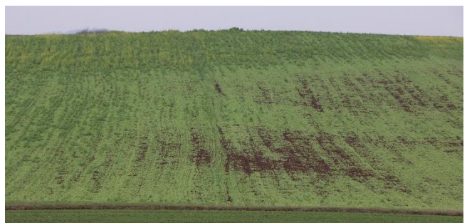
Ungleichmäßiger Aufgang und Entwicklung von Senf: im Hintergrund direkt nach der Saat aufgelaufener gut entwickelter Senf, im Vordergrund Senf, der erst nach Niederschlägen im September aufgelaufen ist.

Ein akzeptabler Aufgang von Zwischenfrucht und Raps wurde erreicht, wenn zeitig gesät wurde, die Ansaat sofort nach der Bodenbearbeitung erfolgte, das Saatbett einen guten Bodenschluss erlaubte und ggf. auch ein Regenschauer fiel.