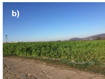
Abb. 1: Zwischenfrüchte Ende Nov 2020: a) lückiger Senf (September-Saat); b) üppiger Senf (Aussaat August)

fehlte der Niederschlag für einen flächigen Feldaufgang. Das Ergebnis sind lückigere, kleinere Zwischenfrüchte (Abb. 1 a) und erhöhte Reststickstoffgehalte.