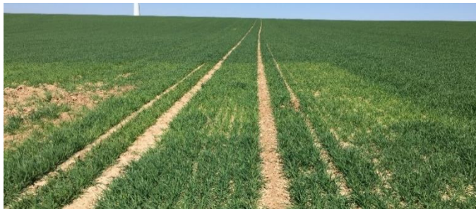
Abb. 4: Weizenbestand während Apriltrockenheit 2020 mit Fenster ohne CULTAN-Düngung durch ausgesetztes Igel-Rad.

Das Klima wandelt sich – Trockenphasen nehmen zu. In den letzten drei Jahren haben wir in besonderem Maße zu spüren bekommen, dass ein gezielter Einsatz von Düngestickstoff (mineralisch/organisch) immer wichtiger wird. Das CULTAN-Verfahren ist eine Möglichkeit im Frühjahr Trockenphasen etwas entgegen zu setzen.