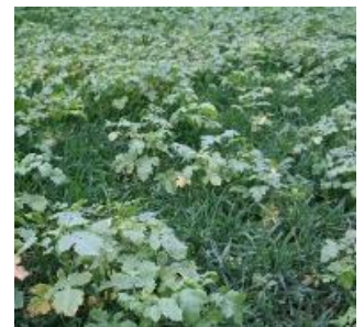
Weitgehend abgefrorene Zwischenfrucht (links) und vitale Zwischenfrucht mit Ausfallgetreide (rechts)

Optimal sind in einem ersten Schritt schneidende Werkzeuge, die das Ausfallgetreide bzw. die Zwischenfrucht sauber vom Wurzelpaket trennen.