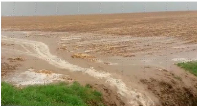
Abschwemmung in den Vorfluter von einem frisch bestellten Acker (geringe Hangneigung, Hanglänge ca. 450 m, 30 l in 20 min) im April 2018

Selbst bei geringen Hangneigungen finden während und nach Starkregenereignissen Abschwemmungen von Bodenmaterial und auch Erosion in größerem Ausmaß statt. Diese Erkenntnis konnte in diesem Jahr vielerorts vertieft beobachtet werden (siehe Foto).