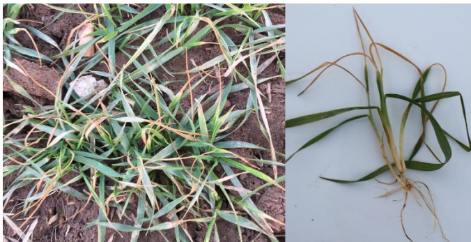
Abbildung 2: „verbräunte“ Blattspitzen (Frostschäden) bei Winterweizen, Aufnahme 22.02.2021

Die Witterung und gesetzliche Vorgaben haben bisher keine Düngung zugelassen. Sobald die Flächen befahrbar werden, sollte angedüngt werden.