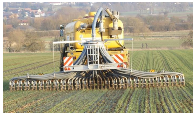
Abbildung 4: Durch Einschlitzen von Gülle in Winterweizen werden Ammoniakemissionen vermindert und die Nährstoffe direkt im Wurzelraum der Pflanzen abgelegt