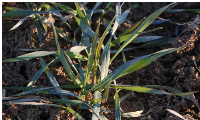
Anthocyan-Verfärbung des Weizens durch Kältestress

Tauen die Böden nächste Woche tagsüber auf, nachts herrscht aber weiterhin Frost, dürfen nicht mehr als 60 kg N/ha ausgebracht werden. Egal, ob mineralisch oder organisch gedüngt wird.