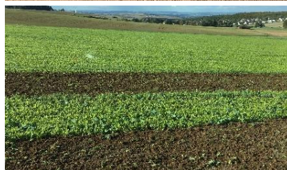
Ramtill-Aussaat mit Grünlandstriegelein in Erbsenstoppel (oben), Einarbeitung Mitte Oktober mit Grubber (unten) vor der Weizenbestellung