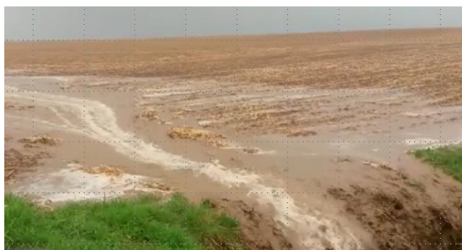
Abschwemmung in den Vorfluter von einem frisch bestellten Acker (geringe Hangneigung, Hanglänge ca. 450 m, 30 l in 20 min) im April 2018

Selbst bei geringen Hangneigungen finden während und nach Starkregenereignissen Abschwemmungen von Bodenmaterial und auch Erosion in größerem Ausmaß statt. Diese Erkenntnis konnte in diesem Jahr vielerorts vertieft beobachtet werden (siehe Foto).