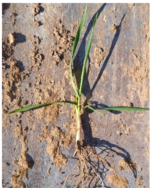
November-Weizen mit nur 1-2 Triebe/Pflanze. Diese Triebe müssen erhalten bleiben.

Der März ist zwar mit einer mittleren Tagestemperatur von 6,0° C (DWD-Station Fritzlar (Flugplatz)) mild verlaufen. Die hohen Tag-Nacht-Temperatur-schwankungen haben das Pflanzenwachstum jedoch entschleunigt. Im ersten Jahresquartal fielen mit 115 mm etwa so viel Niederschlag wie im lang-jährigen Mittel (DWD-Station Fritzlar (Flugplatz)). Der wenige Niederschlag im März, der regional zudem sehr unterschiedlich ausfiel, erschwert aktuell einzelnen Wintergetreiden (Spätsaaten, schlechter Bodenzustand, Herbizidstress) das Wachstum.