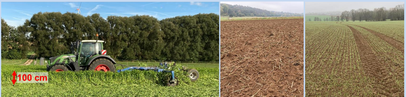
Aussaat von 15 kg/ha Ramtill mit Wiesenstriegel (Ende Juli 2021). Links: Bestand ca. 100 cm hoch, Zerkleinerung mit Messerwalze (01.10.21). Mitte: Saatbeet nach einmaligen Grubberstrich (12-15 cm tief) unmittelbar vor Weizen-aussaat (18.10.21). Rechts: homogener Feldaufgang (12.11.21)

Düngung/N-Nachlieferung zu Weizen: N min -Untersuchung für bedarfsgerechte Düngung durchführen. Start- und Schossergabe normal düngen. Die N-Nachlieferung aus der Sommerbegrünung setzt im Frühjahr mit steigenden Bodentemperaturen ein und wirkt vor allem zur Abschlussgabe.