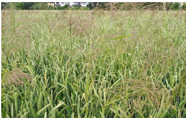
Keine Seltenheit im Jahr 2024. Wintergetreide mit erhöhtem Besatz an Ungräsern (hier: Windhalm)

Das Wetter der ersten Jahreshälfte war insgesamt wechselhaft und konstant unbeständig – kaum eine Woche ohne Niederschlag erschwerte die Feldarbeiten. Insgesamt fiel in der ersten Jahreshälfte jedoch nur etwas mehr Regen als im langjährigen Vergleich (DWD-Station Korbach-Rhena). Die Nässe Ende 2023 erschwerte nicht nur die Aussaat und Herbizidanwendungen im Herbst. Zusammen mit der unbeständigen Witterung konnten Feldarbeiten im Frühjahr nicht immer unter besten Bedingungen erfolgen. Das Resultat sind z.T. tiefe Fahrspuren, Verdichtungen durch Bodenbearbeitung bei Nässe und/oder (stark) verungraste Getreidefelder. Dies sollte beim Nacherntemanagement und der Abstimmung der Fruchtfolge berücksichtigt werden, um optimale Wachstumsbedingungen für die Folgekultur bzw. Zwischenfrucht zu schaffen.