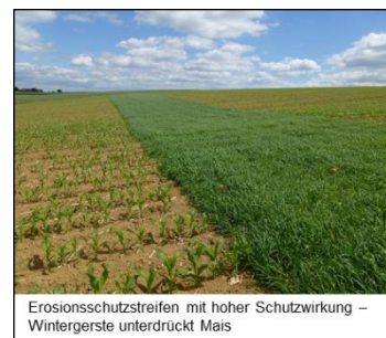
Erosionsschutzstreifen mit hoher Schutzwirkung – Wintergerste unterdrückt Mais

Kräftig bestockter Streifen mit dichter Bodenbedeckung, der die Hauptfrucht unterdrückt.