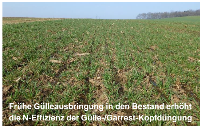
Frühe Gülleausbringung in den Bestand erhöht die N-Effizienz der Gülle-/Gärrest-Kopfdüngung

Dazu folgende Beispiele: Der durch eine Gülle-Kopfdüngung kurz vor oder zum Schossen von Winterweizen ausgebrachte organisch gebundene Stickstoff wird für den Weizen kaum noch rechtzeitig verfügbar werden. Selbst, wenn er mit Schleppschuhen direkt auf den Boden gegeben wird. Denn in Trockenphasen wird kaum Stickstoff umgesetzt und ohne eine größere Menge an Niederschlägen werden die Nährstoffe nicht mehr rechtzeitig in den Boden und an die Wurzeln gelangen.