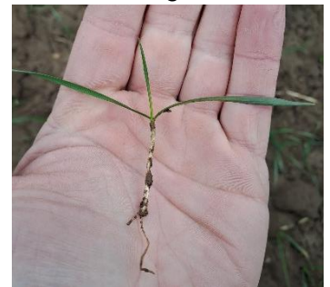
Dezemberweizen – Wurzelwachstum und Bestockung mit nitrathaltigen Volldüngern fördern (Aufnahme: 8.2.24)