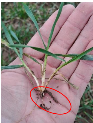
Weizen mit frisch entwickelten Kronenwurzeln, Aufnahme: 8.2.24

Die meisten Wintergetreide- und Rapsbestände zeigen im Moment ein „frühjahrsgrünes“ Bild: die Böden liefern – trotz in der Regel niedriger N_{min} -Versorgung – genug Stickstoff nach, um den aktuellen Pflanzenbedarf zu decken. Das bedeutet auch, dass Sie mit der Andüngung noch warten können, so dass keine „Gleise“ gefahren werden müssen.