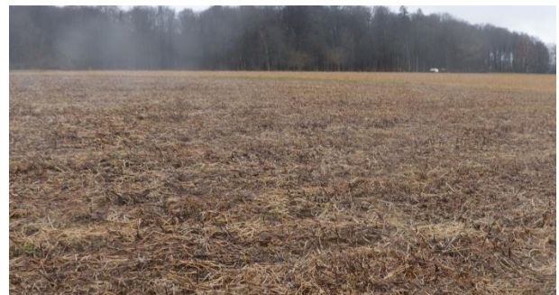
Hauptfruchtmäßig bestellte- und bei Frost gewalzte Zwischenfrüchte bieten die optimalen Voraussetzungen für eine flache Bodenbearbeitung kurz vor der Saat. (Aufnahme: 09.02.2024)

Da die Saat ohnehin nur unter trockenen Bedingungen erfolgen kann, warten Sie daher notfalls mit der Bodenbearbeitung bis kurz vor der Aussaat. Bei sauberen Zwischenfruchtbeständen stellt dies kein Problem dar (s. unten). Nutzen Sie die Wurzelgare der Zwischenfrucht und bearbeiten Ihre Flächen möglichst flach und mit einem flächigen Schnitt.