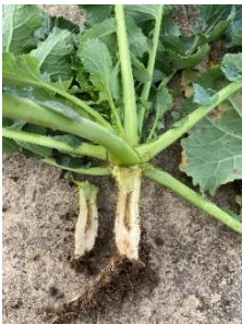
Bormangel bei Raps

Die Rapsbestände haben sich überwiegend gut im Herbst entwickelt und im Mittel 80 kg N/ha (= ca. 1,6 kg Frischmasseaufwuchs pro m 2 ) aufgenommen. Aktuell präsentieren sich die Rapsbestände überwiegend vital. Violett verfärbte Teilbereiche sind kein Nährstoff- sondern Luftmangel aufgrund von wasser- gesättigtem Boden.