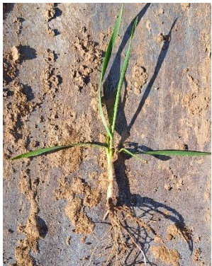
November-Weizen mit nur 1-2 Triebe/Pflanze. Diese Triebe müssen erhalten bleiben.

Der März ist zwar mit einer mittleren Tagestemperatur von 7,6° C (DWD-Station Gr.-Breitenborn) mild verlaufen. Die hohen Tag-Nacht-Temperaturschwankungen haben das Pflanzenwachstum jedoch entschleunigt. Im ersten Jahresquartal fielen mit 143 mm rund 25% weniger Niederschlag gegenüber dem langjährigen Mittel (DWD-Station Gr.-Breitenborn). Der wenige Niederschlag im März, der regional zudem sehr unterschiedlich ausfiel, erschwert aktuell einzelnen Wintergetreiden (Spätsaaten, schlechter Bodenzustand, Herbizidstress) das Wachstum.