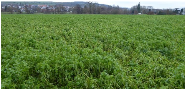
Abb. 3: Vom Frost geschädigte Zwischenfrucht geschädigt. Grünt der Bestand wieder durch, sollte beim nächsten Frost gewalzt werden.

Die teils zweistelligen Minustemperaturen der letzten beiden Wochen haben dafür gesorgt, dass Zwischenfruchtbestände bereits begonnen abzufrieren. Beobachten Sie nun, ob Ihre Bestände mit den kommenden wärmeren Temperaturen noch einmal durchgrünen. Ist dies der Fall, sollten Sie bei der nächsten Frostperiode (mind. -6^{\circ}\text{C} ) die Zwischenfrüchte walzen oder mulchen. Durch das „Umknicken“ frieren die Zwischenfrüchte zuverlässig ab und verrotten schneller. Lassen Sie die Bodenlebewesen die Zersetzung der Zwischenfrucht übernehmen und sparen Sie bei der Einarbeitung im Frühjahr Kraftstoff. Eine hohe Mulchauflage aus abgefrorener Zwischenfrucht nimmt Beikräutern und Ausfallgetreide das Licht zum Weiterwachsen und verhindert Erosion. Warten Sie mit dieser Maßnahme aber in jedem Fall bis der Boden durchgefroren und tragfähig ist, um keine Bodenverdichtungen zu riskieren.