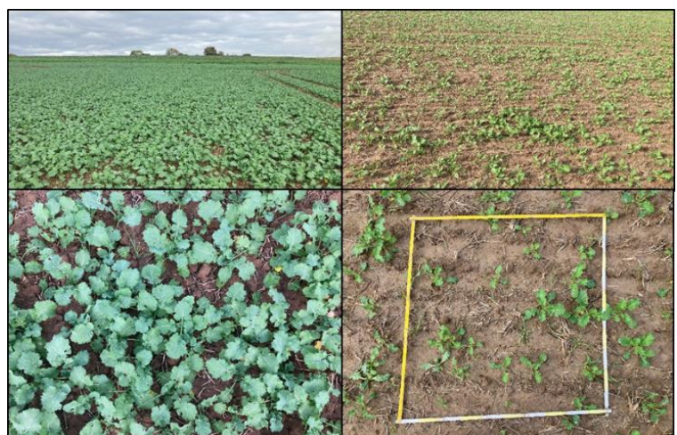
Abb. 1: Zwei Rapsbestände (Entfernung 150 m) - links: Aussaat 29.08.2022 und größere Mulchaufgabe - rechts: Aussaat: 11.09.2022, verschlammter Oberboden

Kräftigere Bestände wurden erreicht, wenn diese eingestaubt (Aussaart vor Mitte September) und mit einer größeren Strohaufgabe vor Erosion geschützt wurden. Wurde auf Regen gewartet, konnten die Flächen anschließend erst Ende September wieder befahren werden. Bei diesen Spätsaaten entwickelten nur noch frohwüchsige Zwischenfrüchte (Senf oder Ölrettich) einen akzeptablen Bestand.