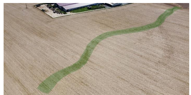
Abb. 3: Begrünung der Tiefenlinie