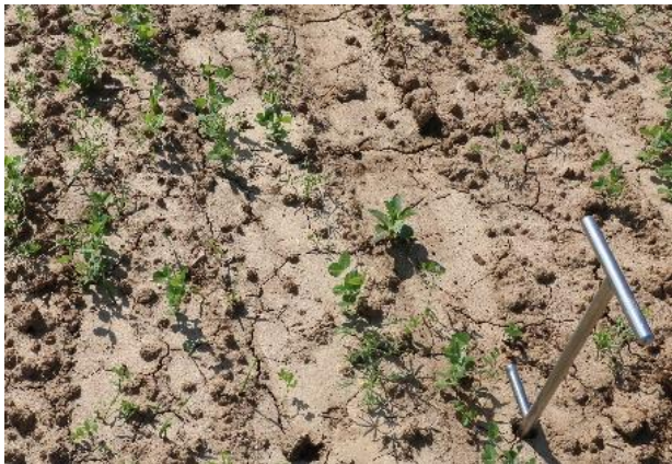
Abb. 4: Stark verschlammter Boden nach Feldebensen. Hier wurde nach der Ernte so tief gearbeitet, dass keine Mulchauflage auf der Fläche verblieb.

Besonders gefährdet für Erosion sind Lössböden mit einem hohem Schluffanteil sowie Böden mit einem hohen Feinsandanteil. Durch die Aufprallenergie der Regentropfen verschlämmt die Oberfläche und das Wasser kann schlecht einsickern (Abb. 4).