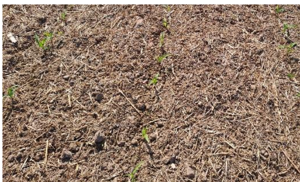
Abb. 5a: Auflaufender Mais mit Mulchschicht ohne Bodenverschlämmung nach einem Starkniederschlag.

Abhilfe kann eine Mulchauflage (Abb. 5a) schaffen, wenn ausreichend viel Streumaterial an der Bodenoberfläche bleibt. Hier gilt, je mehr Stroh desto höher der Effekt bei Starkniederschlägen. Die Energie der Regentropfen wird durch das organische Material abgebremst. Die Mulchauflage dient zudem verschiedensten Bodenlebewesen als Nahrung. Der Boden wird mit einem Netz von Regenwurmgingen durchzogen, wodurch Wasser besser in den Unterboden infiltriert.