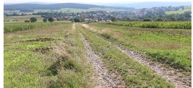
Abb. 7: Um Erosion dauerhaft zu verhindern, wurde das ehemalige Vorgewende mit Feldgras eingesät und stillgelegt.

Die gravierendsten Erosionsereignisse kommen in der Regel bei Hackfrüchten vor. Jedoch gibt es Flächen, welche unabhängig der angebauten Kultur vor allem im Vorgewende Probleme mit Erosion haben. In Abb. 7 ist ein derartiger Flächenkomplex abgebildet. Im ehemaligen Vorgewende links und rechts des Weges traten im Grunde bei jedem Niederschlag Erosionsereignisse auf. Die Vorgewende wurden hier als Schutzmaßnahme aus der Produktion genommen und werden nun zum Wenden der Maschinen genutzt. Die Bearbeitungsrichtung verläuft somit über die gesamten Flächen quer zum Hang. Denkbar ist für diesen Zweck auch die Anwendung des HALM Programmes C.3.3, wenn die Vorgewendebegrünung mind. 6 Meter breit sein kann.