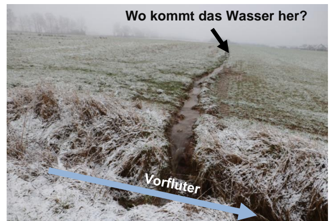
Abb. 1: Entwässerungsgräben quer über die Fläche. Eine sinnvolle Maßnahme?

Das Hauptziel sollte somit immer sein, dass Wasser breit auf der Fläche versickern zu lassen, auf der es auch niedergereget ist. Hier bietet sich statt der Grabenfurche die Anlage eines dauerhaften Begrünungstreifens an (Abb. 3).