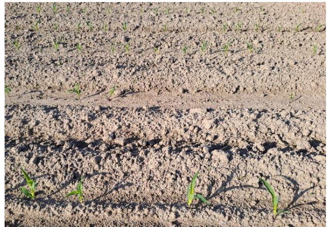
Abb. 5b: Die Mulchauflage macht hier den Unterschied: Nach einem Starkregenereignis am 25.05.2023 war in Pflugsaat bestellter Mais in den Säreihen verschlämmt. Der in Mulchsaat bestellte Mais der Nachbarfläche zeigte hingegen keine Verschlämmung (Abb. 5a).