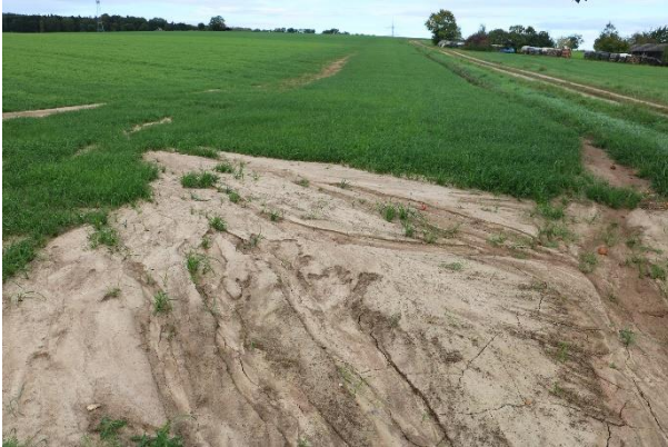
Abb. 6: Spuren von starker Erosion in Landsberger Gemenge

Abb. 6 zeigt starke Erosion nach mehrere Starkregenereignissen in frisch gesättem Landsberger Gemenge im August 2023. Im Jahr 2024 soll auf dieser Fläche Mais wachsen. Da im Betrieb keine Technik zur flachen, schneidenden Bodenbearbeitung vorhanden ist, soll die Fläche nach einer Nutzung im Frühjahr gepflügt werden. In diesem Fall wird die Fläche nicht komplett bearbeitet, sondern die Erosionsschutzstreifen bei der Bodenbearbeitung ausgespart. Insbesondere in den Vorgewenden war die Fläche derart abgeschwommen, dass Feldgras nachgesät werden musste.