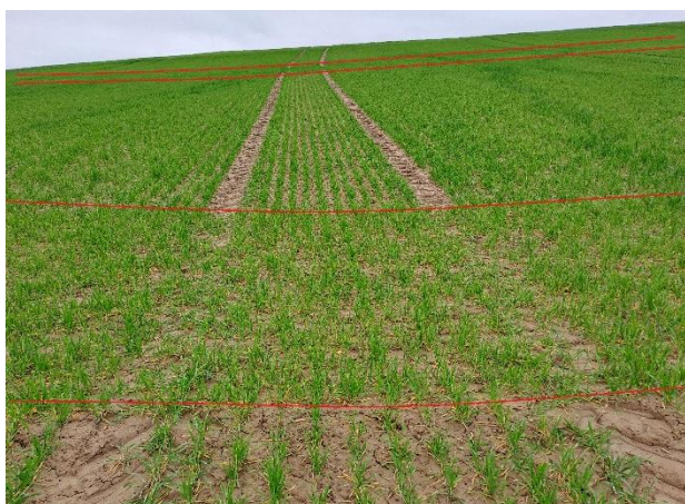
Abb. 10: Fahrgassenbegrünung durch querdrillen von Wintergetreide. Angelegt wurden hier mehrere Querreihen.

Bei Flächen, die quer zum Hang bewirtschaftet werden, verläuft die Fahrgasse im Vorgewende hangabwärts und kann auch hier Erosion fördern. Mit einer gezielten Begrünung nur dieser Fahrgasse kann das fließende Wasser ausgebremst werden (Abb. 9). Ist keine Bewirtschaftung quer zum Hang möglich wäre eine weitere Möglichkeit die generelle Fahrgassenbegrünung aller hangabwärts gerichteten Fahrgassen .