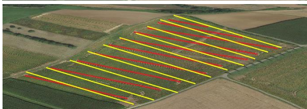
Abb. 8: Ausrichtung der Fahrgassen an der unteren Schlaggrenze (rote Linien, Bild oben) und an der oberen Schlaggrenze (gelbe Linien, unten). Im oberen Bild werden die Fließwege des Wassers durch die Ausrichtung unterbrochen.