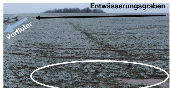
Abb. 2: Fläche aus der oberen Abbildung von unten fotografiert. Das Wasser bricht aus dem gezogenen Graben aus und sammelt sich in Mulden am unteren Teil der Fläche.