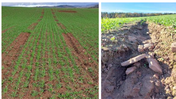
Abb. 9: Rechts: Freigeschwemmte Fahrgasse vor der Begrünung. Links: Beispiel für partielle Fahrgassenbegrünung ein Jahr später auf derselben Fläche