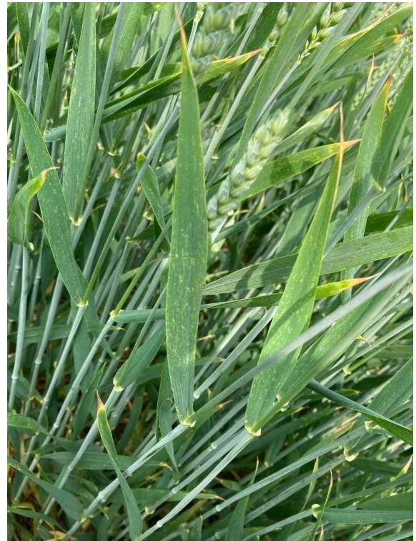
Reduzierte Photosyntheseleistung durch gesprenkelte Blätter (Wetterstress) und verbrannte Blattspitzen („scharfe“ Pflanzenschutzanwendungen), Langenselbold, 08. Juni 2021

Es ist also entscheidend, dass alle genannten Faktoren passen, damit der standortspezifische Höchstertag sowie ein entsprechend hoher Rohproteingehalt generiert werden können. Stimmt einer der Faktoren nicht, kann der Ertrag aber auch die Qualität leiden – Stichwort „Liebig-Tonne“.